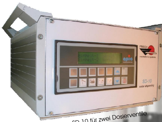
Steuerung SD-10 für zwei Dosierventile